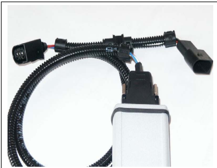
Mercedes CDI Kabel-adapter