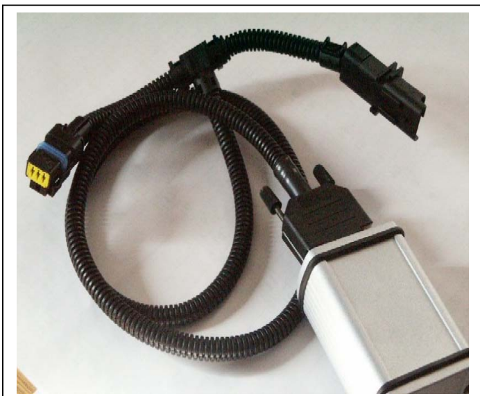
HDI Bosch ,Siemens- Delphi Kabel-adapter